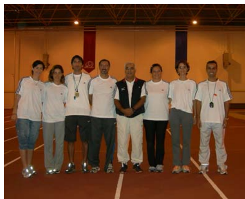
Participants au Stage pour Conférenciers de Niveau I — Université d'Eskisehir, Turquie

Par ailleurs, la Fédération Turque d'Athlétisme cherche à établir des passerelles entre l'EPS à l'école, le Sport dans 3 Universités turques et l'IAAF : tous œuvrent pour le développement du Sport et la Formation, et la nécessité d'accroître le nombre d'instructeurs/entraîneurs