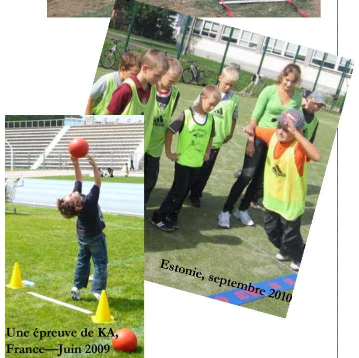
Une épreuve de KA, France—Juin 2009