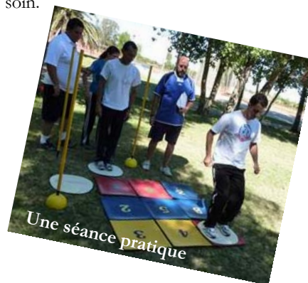
Une séance pratique

L'IAAF a financé le stage, hébergement et transport aérien des participants compris, et a fourni les documents nécessaires au cours pour la formation nationale. Enfin, l'IAAF a fourni cinq kits de matériel Kids Athletics à chaque Fédération qui s'est engagée auprès de l'IAAF à proposer un plan de développement durable du programme KA dans leurs écoles respectives. Elles soumettront d'ailleurs un rapport d'activité mensuel au CRD Santa Fe. Elle s'attacheront à faire la promotion du Kids Athletics autant que possible dans les médias locaux. Bien entendu, elles pourront bénéficier de l'assistance du CRD en cas de besoin.