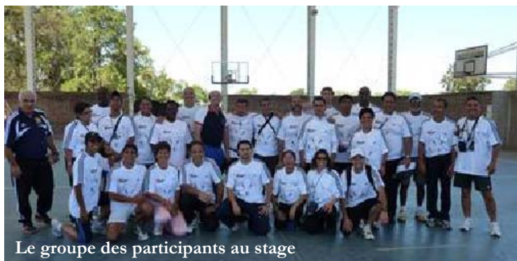
Le groupe des participants au stage

Dans le cadre du Plan Mondial pour l'Athlétisme , l'IAAF a mis en œuvre un programme de développement pour les clubs mais aussi et surtout pour les écoles. En octobre 2008, un premier stage-pilote a inauguré une série de projets spécifiquement orientés vers les écoles, dans les différentes zones continentales IAAF, et l'Amérique du Sud vient à son tour de se lancer dans ce projet.