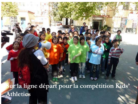
Sur la ligne départ pour la compétition Kids' Athletics