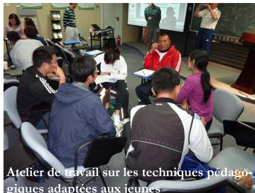
Atelier de travail sur les techniques pédagogiques adaptées aux jeunes

Le groupe d'âges des athlètes ciblés par ce séminaire est celui des 13-15 ans: cette période est cruciale et nécessite un entraînement spécifique, différent de Kids' Athletics et de l'athlétisme des seniors. Ce stage est important pour la formation continue des Conférenciers et des animateurs en Asie, et nécessaire à la bonne transition des jeunes catégories de KA vers les cadets et juniors. Par ailleurs, ce séminaire est pertinent pour consolider les premiers talents de notre sport, et pour mettre en œuvre le Plan Mondial pour l'Athlétisme de l'IAAF.