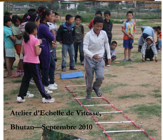
Atelier d'Echelle de Vitesse, Bhutan—Septembre 2010