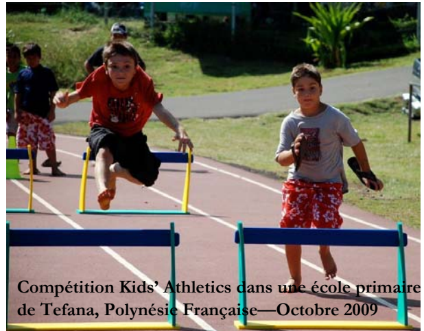
Compétition Kids' Athletics dans une école primaire de Tefana, Polynésie Française—Octobre 2009

La Fédération Bolivienne d'Athlétisme a approché le Ministère de l'Education pour discuter de la possibilité de signer un accord entre l'IAAF et le Gouvernement Bolivien. La Fédération coordonne avec le Ministère de l'Education Nationale l'organisation de stages Kid Athletics pour enseignants d'EPS dans neuf régions du pays, et cet Accord viendra soutenir de manière effective ce projet. A suivre.