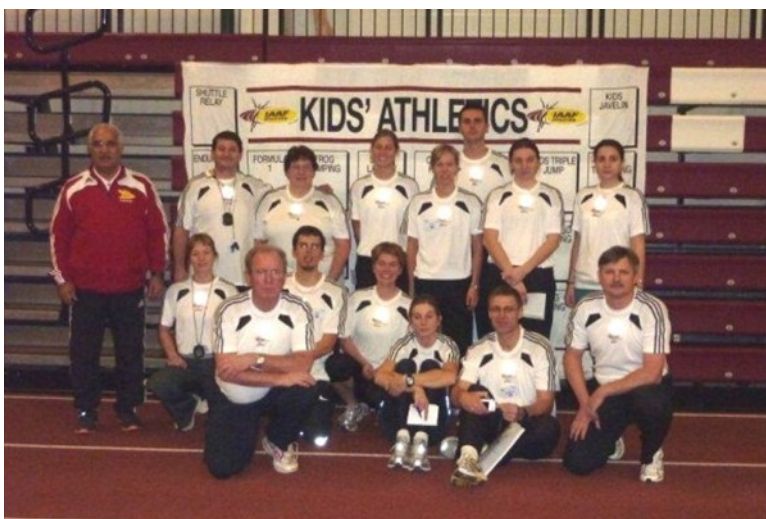
Participants au stage de Tallinn, décembre 2010.

A l'issue du stage, tous les participants ont été affecté à une tâche (qui tient compte de leurs obligations professionnelles) qui vise la diffusion du programme "Kids' Athletics" dans leur pays.